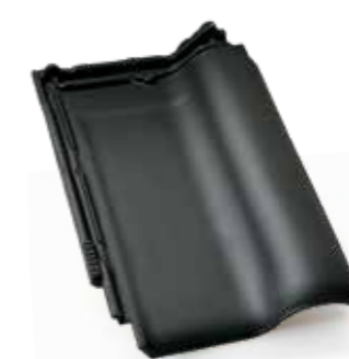
Antracitová engoba (mat)